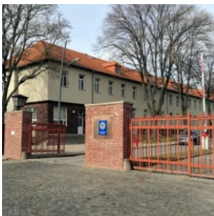
Sachsen-Anhalt: „haben Polizisten im System, die nicht dem Anforderungsprofil entsprechen“

( http://www.epochtimes.de/politik/deutschland/ein-bescheuertes-land-a2415678.html?latest=1 )