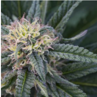
Die (verführerischen) Blumen des Bösen – Essay von Manfred von Pentz

( http://www.epochtimes.de/feuilleton/eure-kinder-von-khalil-gibran-a2416066.html?latest=1 )