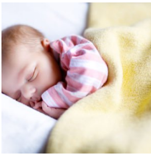
Eure Kinder – Von Khalil Gibran

( http://www.epochtimes.de/feuilleton/eure-kinder-von-khalil-gibran-a2416066.html?latest=1 )