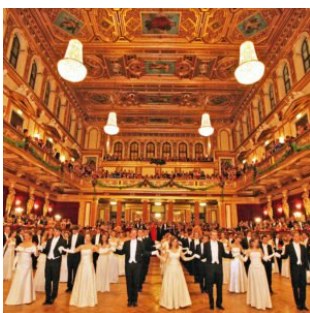
„Das Charakteristische jeder großen Kunst ist: Sie lastet nicht, sie schwebt und macht, dass wir mit ihr schweben“

( http://www.epochtimes.de/politik/deutschland/sachsen-anhalt-haben-polizisten-im-system-die-nicht-dem-anforderungsprofil-entsprechen-a2415371.html?latest=1 )